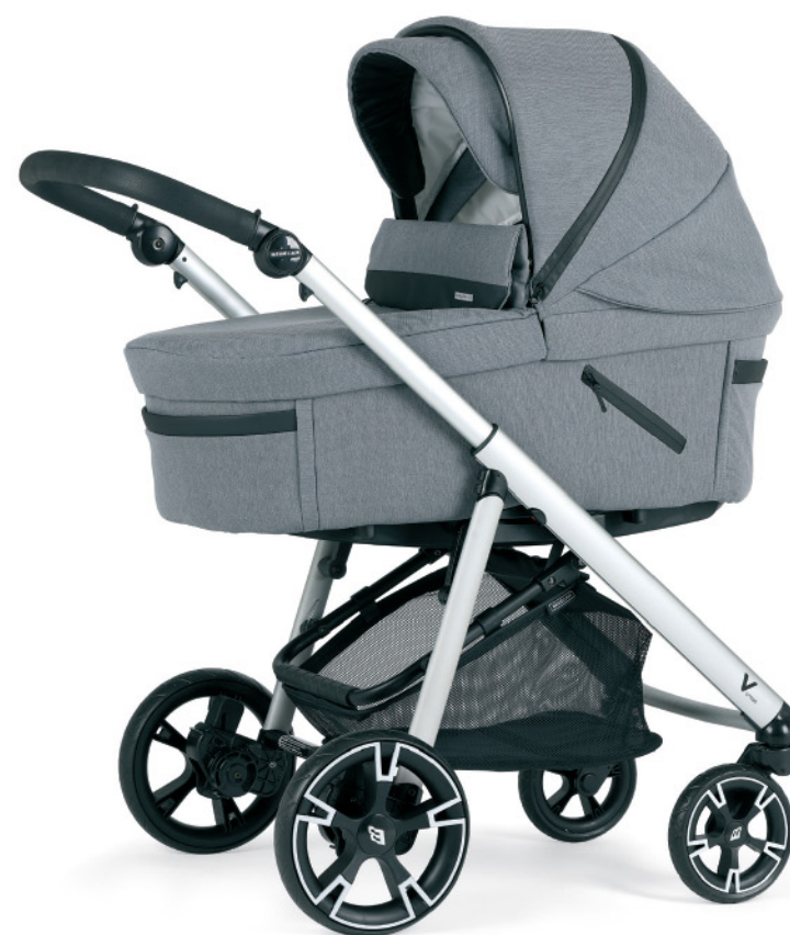
KR164 Chasis anodizado - negro. Disponible en cromado - negro o negro mate.