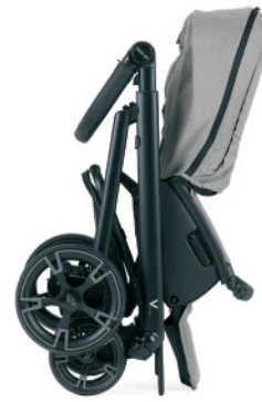
Permite cerrar la silla con la hamaca acoplada.