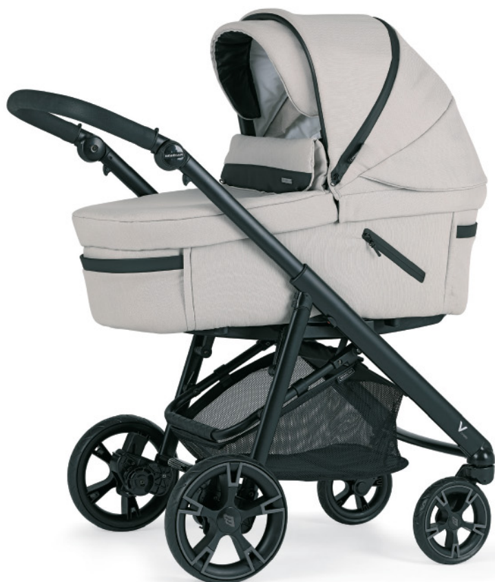
KR160 Chasis negro mate. Disponible en cromado - negro o anodizado - negro.