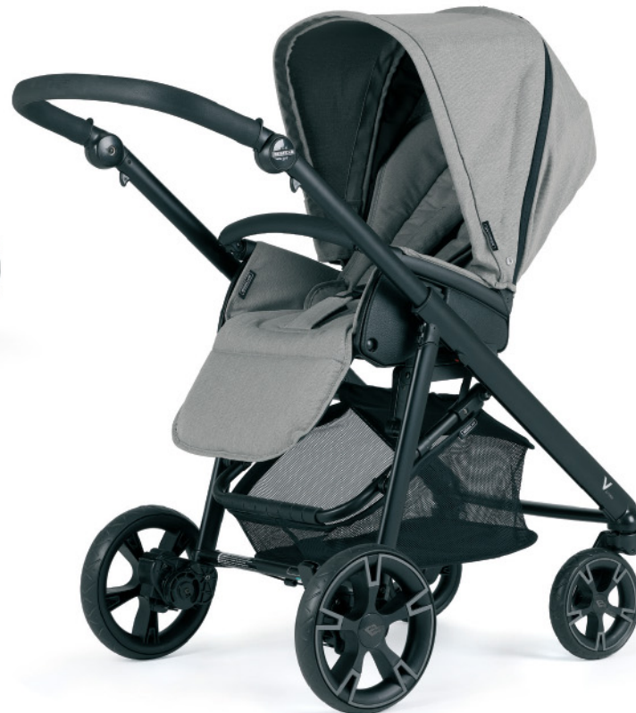
Hamaca reversible IPB con la capota extra incluida. Cesto incluido.