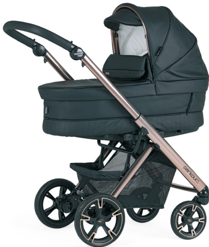
SP056 Chasis fumé rosa - negro con capazo PLW.