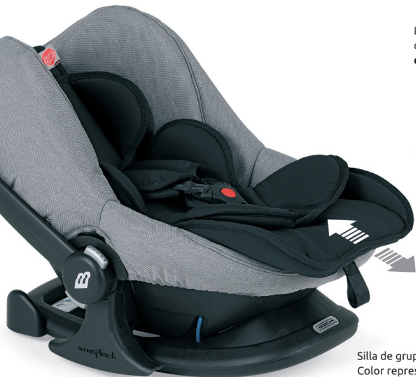
Silla de grupo 0+ Easymaxi LF opcional. Color representado R163 .