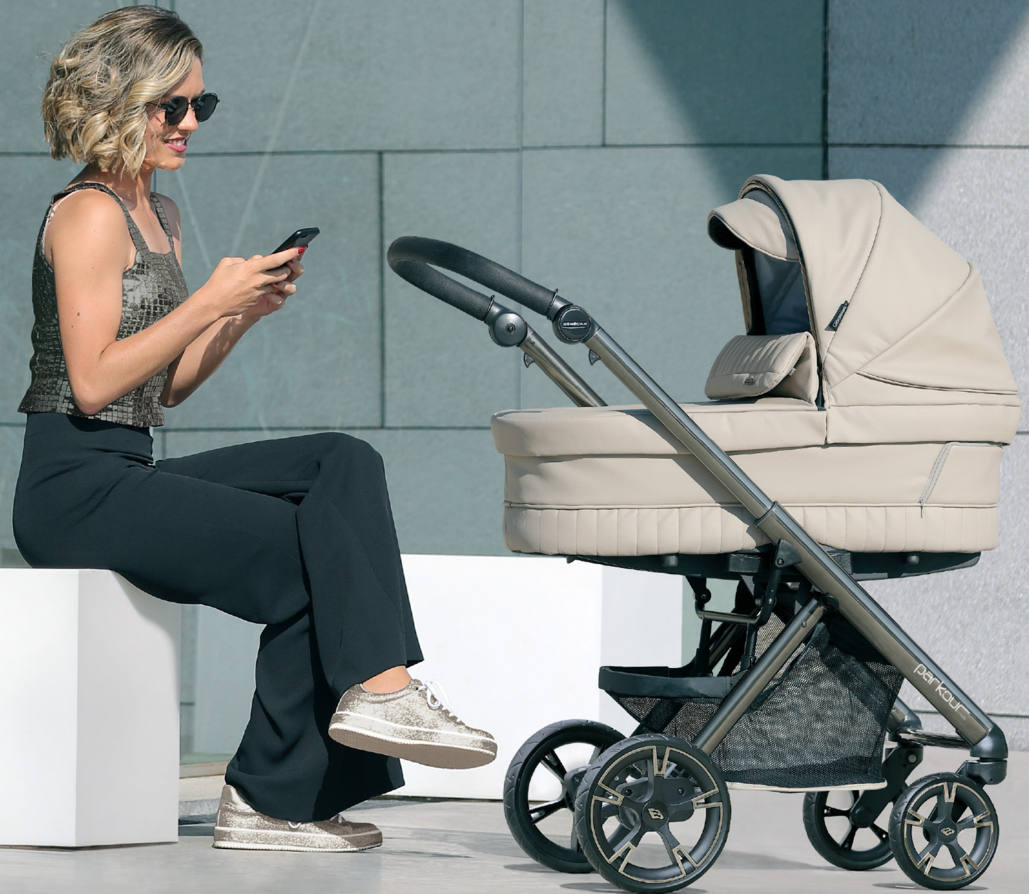
Parkour Cross SP053 con capazo PLW y chasis fumé - gris.