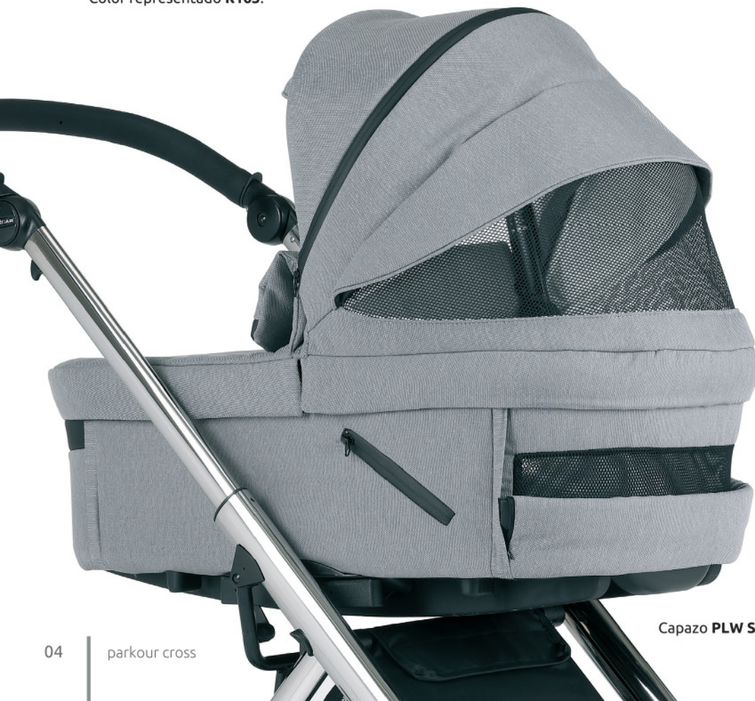
Capazo PLW Sport .

La capota y la base de los capazos PLW/PLW Sport están equipadas con ventana de rejilla para una ventilación extra. Color representado R163 .