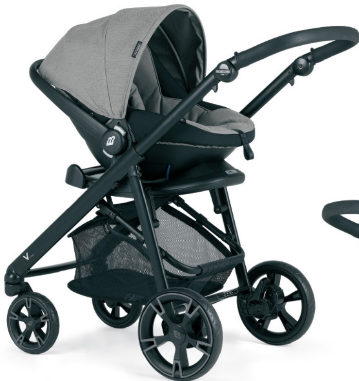
Silla de grupo 0+ Easymaxi Basic , incluida en Pack V-Cross 'Trio'. Fácil adaptación al chasis y al automóvil.

Chasis negro mate. Disponible en cromado - negro o anodizado - negro.