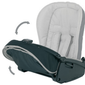
Hamaca plegable para facilitar su transporte y almacenaje.

El capazo del Pack V-Cross no puede ser utilizado en el automóvil.