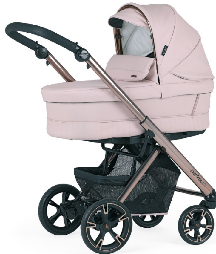
SP057 Chasis fumé rosa - negro con capazo PLW.