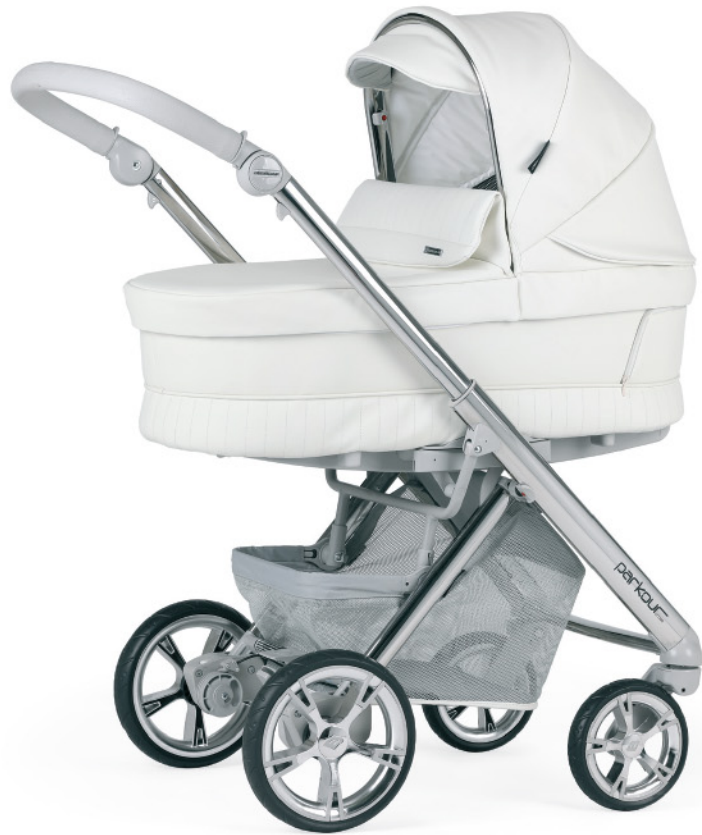
SP050 Chasis cromado - gris topo con capazo PLW.