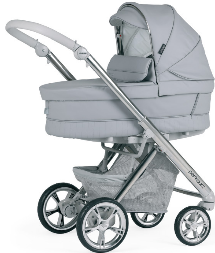
SP051 Chasis cromado - gris topo con capazo PLW.