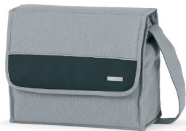
Bolso Carré opcional R163 .

El capazo del Parkour Cross no puede ser utilizado en el automóvil.