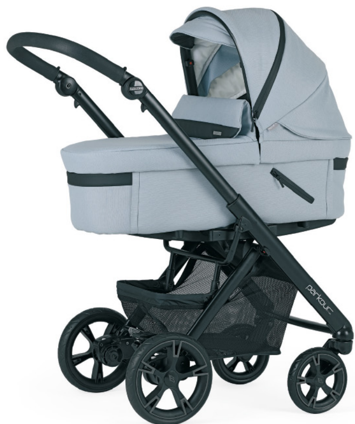
R162 Chasis negro mate con capazo PLW Sport . Disponible en cromado - negro.