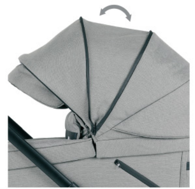
La capota del capazo Z-Bob es extensible y está confeccionada en tejido con protección solar UPF50+ .