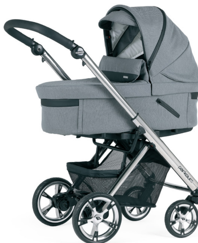
R164 Chasis cromado - negro con capazo PLW Sport . Disponible en negro mate o anodizado - negro.