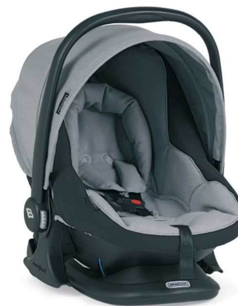
También disponible en versión BASIC sin el sistema de regulación del respaldo.

La capota y la base de los capazos PLW/PLW Sport están equipadas con ventana de rejilla para una ventilación extra. Color representado R163 .