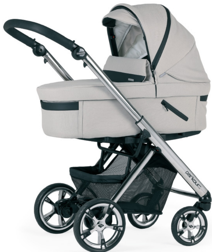
R160 Chasis cromado - negro con capazo PLW Sport . Disponible en negro mate o anodizado - negro.