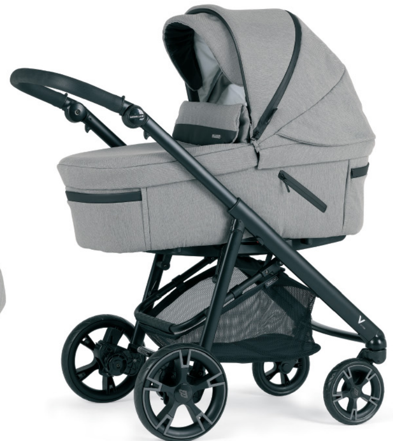
Capazo Z-Bob con asa integrada en capota. Bolsillo en la lateral del capazo.